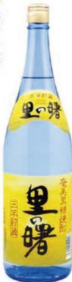
「里の曙」 25度 1800ml