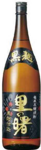
「里の曙黒麴仕込」 25度 1800ml